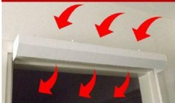
Värmeförflyttaren utan kanalen

I komplett paket ingår ett antal fläktmoduler på den längd du köper, gavelpar, 3 m skarvkabel, väggfäste, strömförsörjning med omkopplare för 6 olika hastigheter. Kanalen säljs separat i 40cm,60cm,80cm,100cm & 120cm