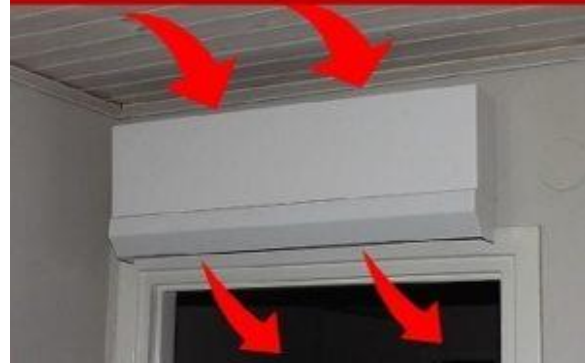
Dubbel effekt med kanalen

Vår vision och affärsidé är vi ska utveckla kvalitetsprodukter med smarta och enkla lösningar – få bättre komfort, energibesparing, miljövänlig och till låga kostnader för både företagare och privatpersoner