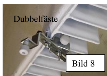
Bild 8. Dubbelfäste kan du montera precis eller tvärtom med fästhållare som i bilden ovanför. Denna fäste innehåller en armshållare och två fästhållare.

Bild 7. Väggfäste monterar man minst 2,5cm ifrån under elementet på väggen. Vi rekommenderar detta fäste när alla andra fästen inte passar eller till plåtelement som kan ske oväsen.